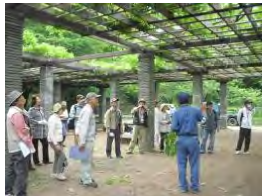
5月に開催されたフジの研修会の様子