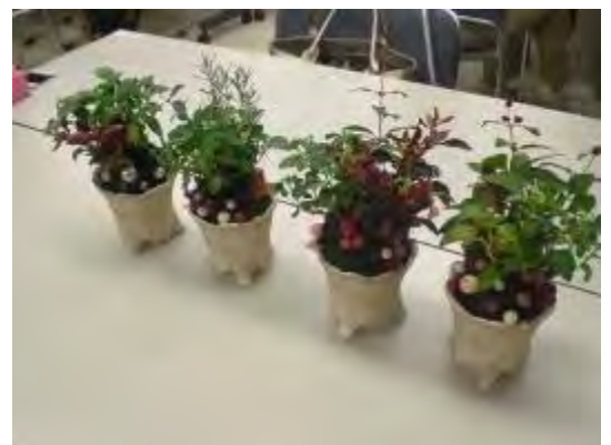
カラービーズを飾って完成