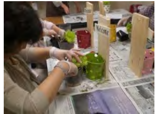
植物を植え付けていきます