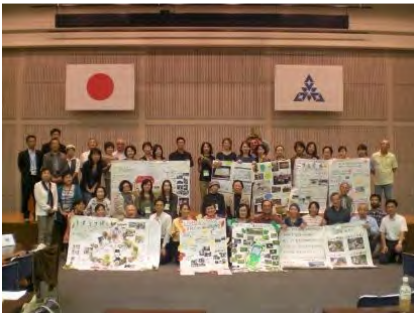
各グループ発表の模造紙を持って記念撮影

最後に36名の方に修了証の交付があり、皆さん晴れやかな顔で無事に講座を修了する事ができました。