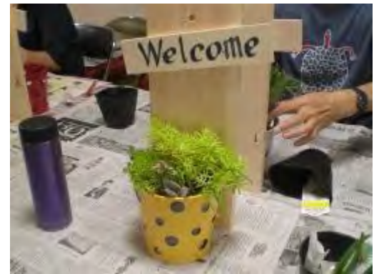
おしゃれな作品が完成