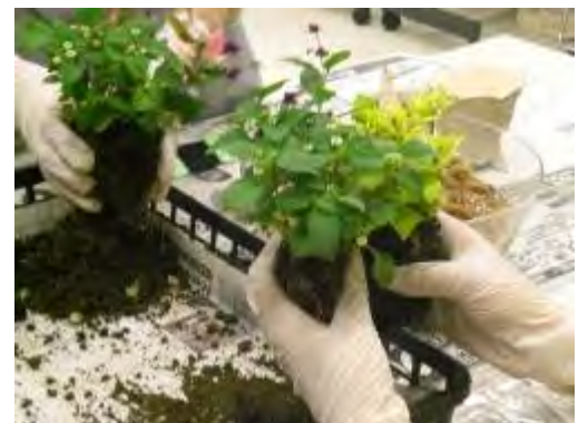
3種類の植物をバランスよく組み合わせます

受講生のひとりに、メキシコからの留学生が参加して下さっていましたが「日本の伝統こけ玉作り体験が出来て興味がわいた」と喜んでいただけた事も、私達の次回講座への励みともなっていて嬉しかったです。