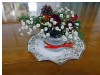
可愛いケーキが完成