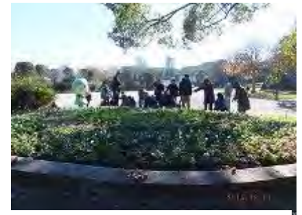
グリップと一緒に記念撮影