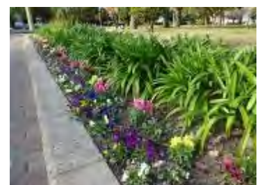
「フラワースポットつくば開成」の花壇