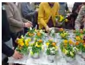
好きな色合いの花を選びます