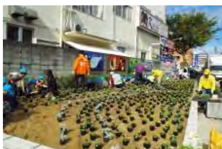
みんなで楽しく植え付けました