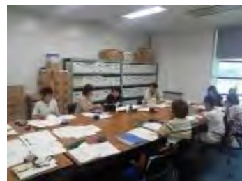
デザイン研修会の様子