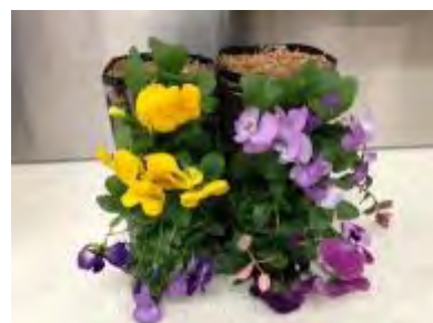
色合いが違う作品が完成

花を植えながら土に触れ、皆さんニコニコ顔で作品が上がり、私もとても充実した時間、楽しい嬉しい講座でした。