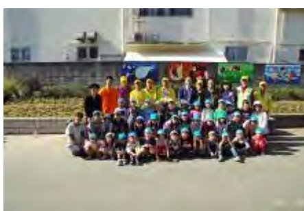
保育園児と記念撮影