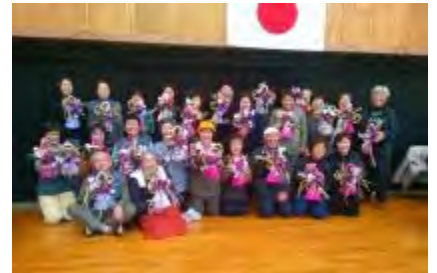
素敵な笑顔で記念撮影

早い時期からお声をかけてくださり、ありがとうございました。とても賑やかな楽しい講座になりました。