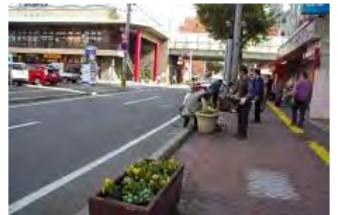
通りのコンテナにも春の花を植栽