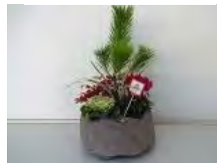
お正月の飾りを挿して完成