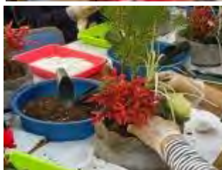
植物の高さ、向きを考えて植栽