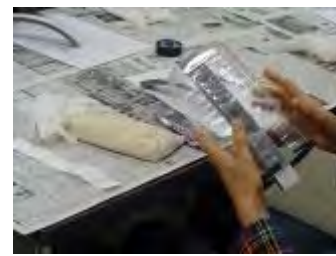
花を入れる部分にすき間テープを貼る