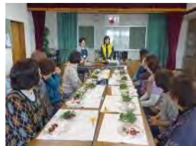
講座の進め方を説明

博多湾に浮かぶ玄界島。当日は天候にも恵まれ、ベイサイド出港の船は、あっという間に玄界島に着きました。