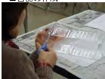
ペットボトルの上部を切り取る