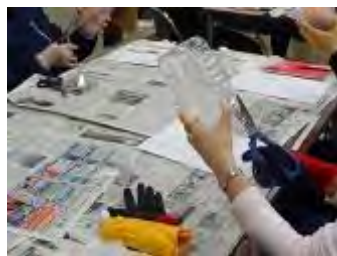
花を入れ込む部分を切り取る