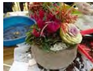
手前に寒水石・奥に苔をのせました