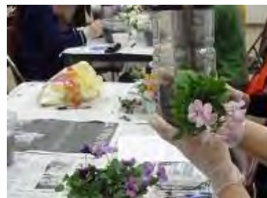
順番に花を入れていきます

2ℓ角型のペットボトル(硬いもの)を持参していただき、加工して容器を作りました。その中に「よく咲くスミシ」3ケと「ハツユキカズラ」1本を入れてペットボトルで花飾りを作りました。