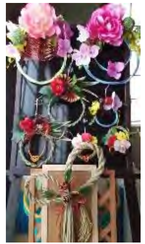
個性あふれる作品が完成

松島公民館・省エネ講座の後に「縁起物のお正月飾りを作しましょう」の講座依頼がありました。