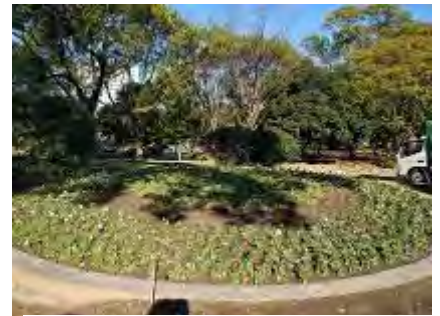
球根が植え終わった花壇