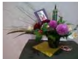
公民館にも作品を 展示しました

館内用に大きなアレンジメント作品も作って、飾らせていただきました。忙しい師走に早目にお花の準備が出来たことで「気持ちが少し楽よね～」と喜んでいただきました。