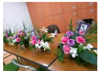
お正月を彩る作品が完成