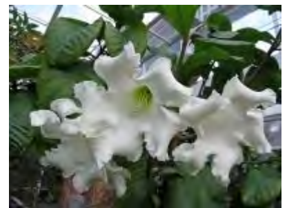
ポーモンティア グランディフローラ