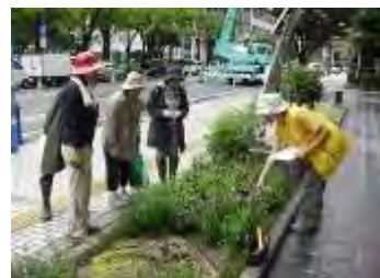
現場での維持管理の様子