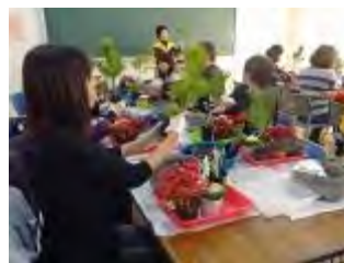
植え方のポイントを説明