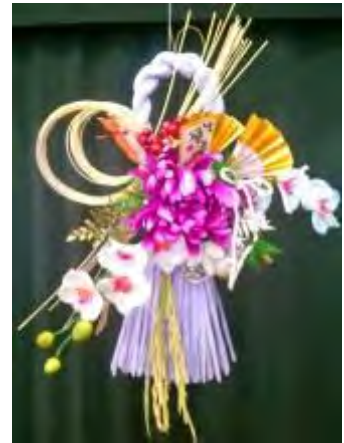
華やかなしめ縄が完成

昨年の1月にお声かけを頂いた、内野公民館『高齢者ふれあい学級』でしめ縄の飾りを作りました。館長さん、主事さんも出席して下さり33名の参加がありました。