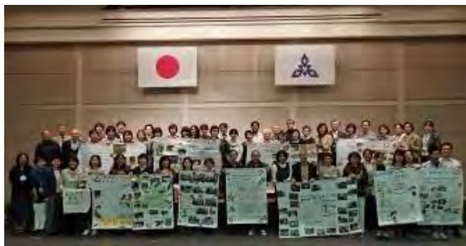
発表のポスターを持って記念撮影