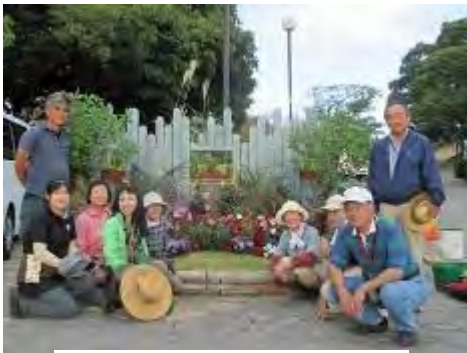
植え付け後の集合写真

これからも「みどりちかまる」は“まちのなかを彩る花と緑”を通して、多くの笑顔が出会う駅作りを目指したいと思います。