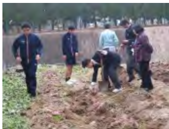
楽しいサツマイモ掘り風景

サツマイモの後は、今月中旬にタマネギの植付け、2月にジャガイモの植え付けを予定しており、生徒達と一緒に、園芸の面白さを味わいたいと思います。