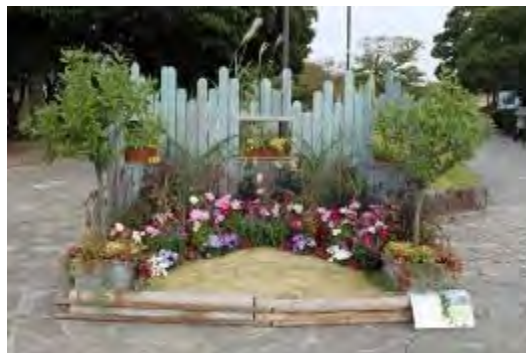
華やかなフロントガーデン