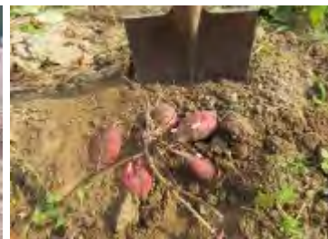
一本の苗から5個収穫