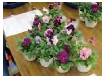
テーブルの上に並べてみます