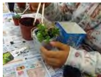
割り箸で一つずつ植えていきます