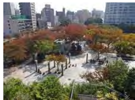
アクロス山から見た紅葉