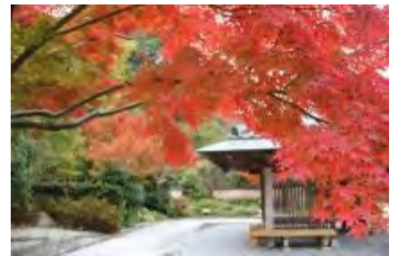
モデル庭園の様子