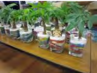
個性あふれる作品が完成