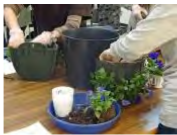
順番に入れていきます