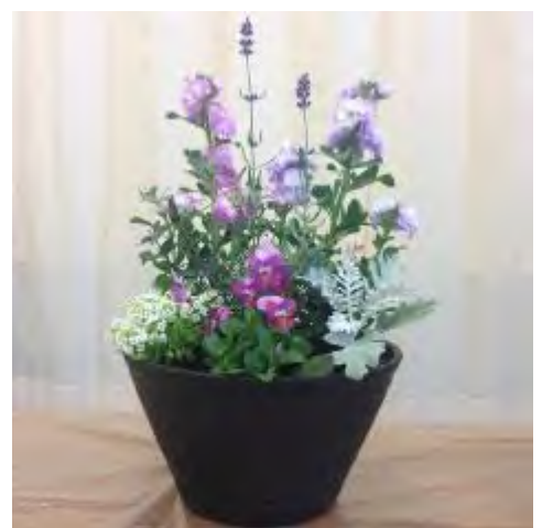
春まで楽しめる寄せ植え

ストックの花の香りが部屋中に広がり、皆さんは和やかに寄せ植えづくりを楽しまれました。