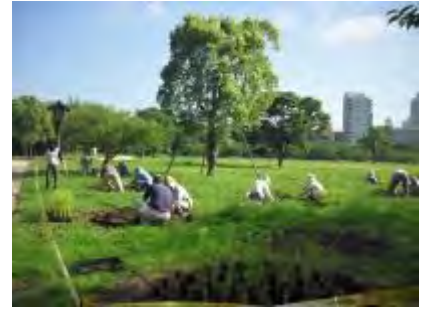
コスモスの植え付けの様子