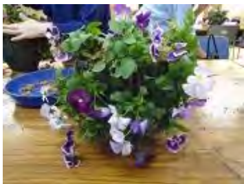
優しい色合いの作品が完成