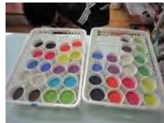
好きな色を4色選びます