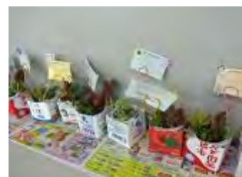
持ち帰り用の牛乳パックに入れました