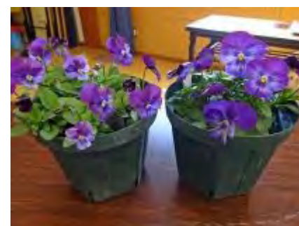
左がよい土で育てたパンジー株がしっかりしています