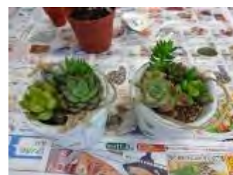
それぞれ違った作品が完成