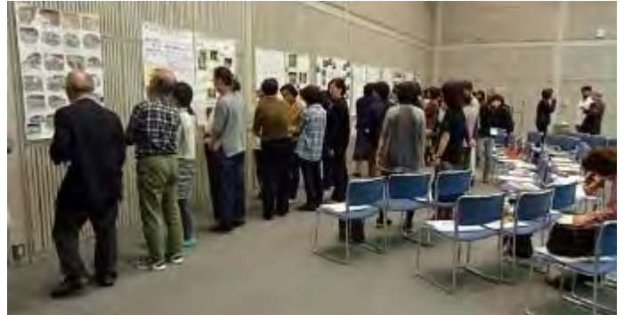
ポスターの前で自由に意見交換を行いました