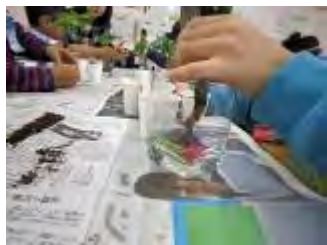
ガラスの器にカラーサンドを入れていきます