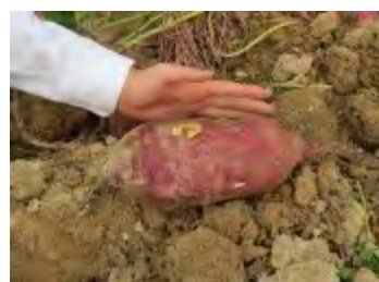
重さ1kgの巨大なサツマイモ