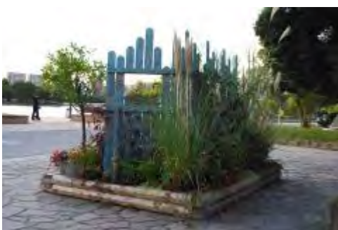
バックガーデンはグラス類を主に植栽