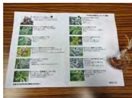
配布資料とドングリのプレゼント

最後に、心ばかりのプチプレゼント(ドングリの詰め合わせ)を参加者の皆さんにお配りし、約1時間の樹木ウォッチングを無事終了しました。