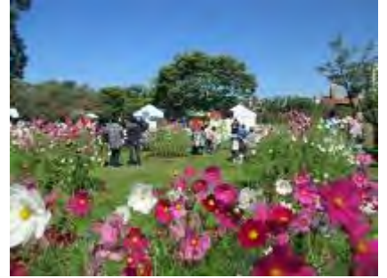
きれいに咲いたコスモス