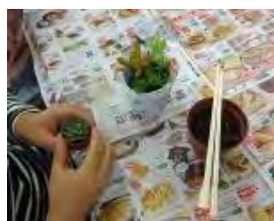
これはどこに入れようかな?