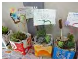
感謝の気持ちを書いたメッセージカードを挿しました