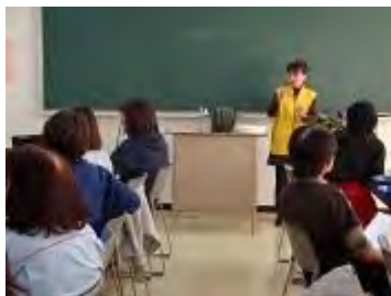
管理の仕方について説明

苗の向きや角度など、細かい注意点もお伝えしながら丁寧に指導させていただきました。ハンギングバスケットづくりが初めてという方も多かったのですが、とても丁寧に作られ、きれいに仕上がっていました。