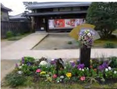
旧伊藤伝右衛門邸の花壇

昨年の最優秀賞・市長賞受賞団体は、活動の予定・当番表（花の手入れ・清掃）・報告などを毎月発行し、次点だった団体は「何処が違うのか？」花壇視察に訪れて、各団体が美しさを競い合い、「花いっぱい」が広がっているようです。