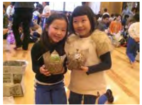
作品を手に笑顔で記念撮影「大切に育ててくださいね」