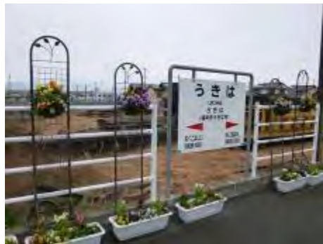
『うきは駅』 看板の左右にハンギングをかざりました