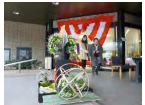
飯塚信用金庫本店

今回、お話を伺い、「花いっぱい華のあるまちに」を勧める「飯塚市花いっぱい推進協議会」の皆さまの熱意・行動力・チームワークの良さに心を打たれました。また、引き続き、益々興味深いお話が聞けそうな予感がします。私たちも見習って、頑張っていこうと思いました。