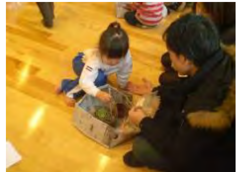
親子で仲良く植え付けを行いました

そして、園長先生からは「最近はゲームやDVDなど様々なメディアが身近な存在になり、仕事や家事、育児に追われ、つつい子ども達に与えてしまい、親子での時間が減少する傾向にあるようで、今回の教室を通して、親子で過ごす時間の大切さを見直してほしい」とのお話がありました。