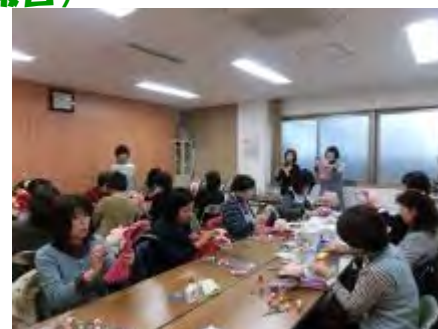
みなさん真剣に取り組んでいます

小田部公民館さんからの依頼で10月に「多肉植物のこけ玉風アレンジ」の講座をさせていただきました。今回は「しめ飾り」を小田部校区の皆様と作るようになりました。