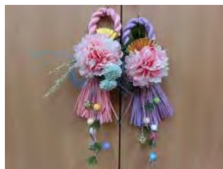
きれいなしめ飾りが完成