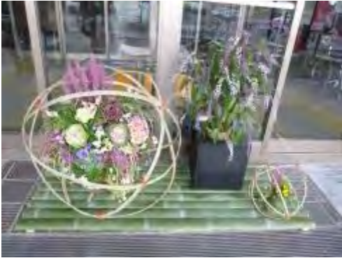
飯塚市役所の正面玄関

コスモスコモン、歴史資料館にも、手入れの行き届いた、その場の雰囲気合った立派な花飾りがありました。