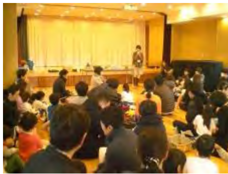
ホールは子ども達と父兄でいっぱいになりました