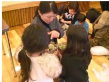
園長先生に作品を見せに来ました「上手にできましたね」