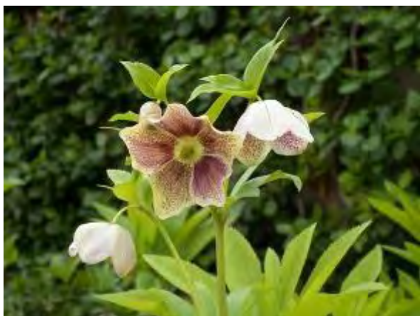
クリスマスローズ（針葉樹園）

さて、今年も3月17日（火）より、第17回福岡市植物蘭展を開催します。ランの愛好団体による各種ランの展示や緑のコーディネーターによる体験講座、ランの販売を行います。また、3月22日（日）に福岡中央高等学校吹奏楽部によるガーデンコンサートを開催いたします。皆様のご来園を心よりお待ちしております。