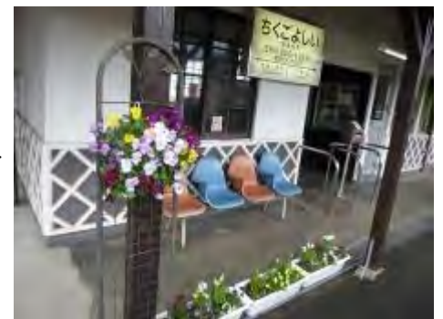
『筑後吉井駅』 改札口付近が明るくなりました