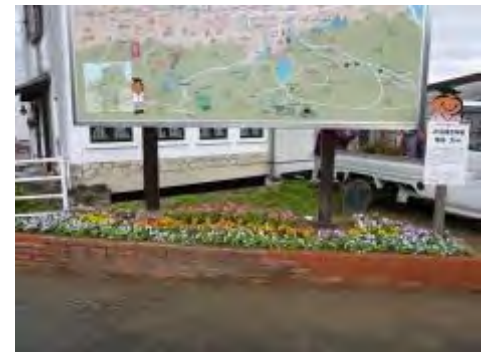
『筑後吉井駅』 駅前の花壇も早春の装い

「筑後吉井駅」は白壁の町の雰囲気を持つ、モトーンの建物なので、黄色やピンク・オレンジの明るい花彩られて、改札口付近が華やかになりました。