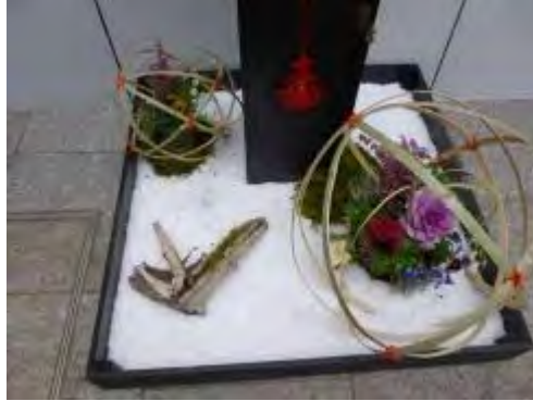
飯塚信用金庫の花飾り