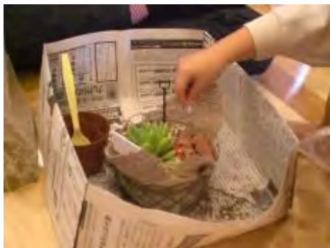
動物やミニスコップをどこに飾るか悩みます

植物を育てる事が、親子のコミュニケーション作りのきっかけのひとつとなれば、大変嬉しいです。