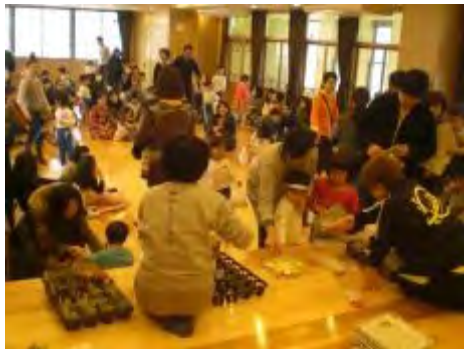
保護者参観が終わって親子が次々と集まってきました

「多肉植物は何種類ありますか?」「どうして多肉っていう名前なんですか?」「お花はいつ咲きますか?」「植物の始まりはいつですか?」など、可愛らしくも大人顔負けの質問も飛び出し、ちょっとしたミニ授業に、私も楽しいひとときを過ごさせていただきました。