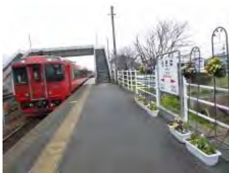
『うきは駅』 「ななつ星」がこの駅に停まります