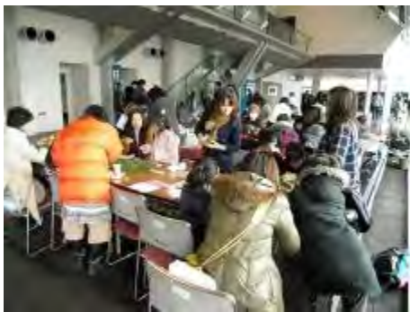
多くの来場者で賑わいました

低学年の男の子が自分の作品の香りを嗅いで「めっちゃ癒される～」^_^の声に、周りの方から笑みがこぼれました。また、参加者の青年が、とても繊細でかわいい作品を作成しているのを見て、私自身の勉強にもなり様々な発見ができた2日間でした。