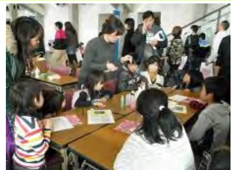
グループごとに説明していきます

香りの世界をまだまだ知らない方が多いので、またイベントなどで少しずつ広めていきたいと思えます。