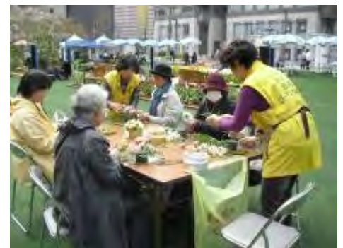
昨年の講座の様子