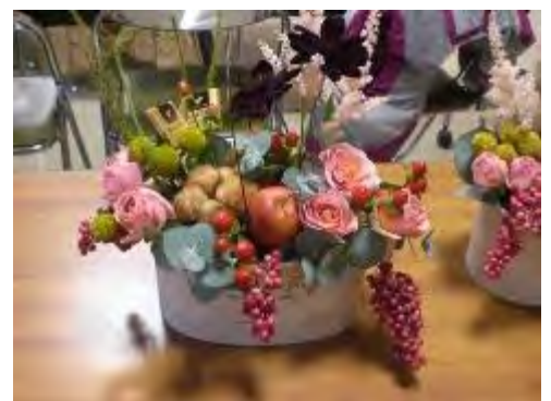
珍しい花材が沢山入りました