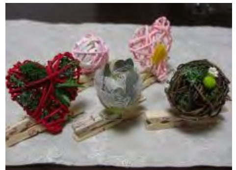
素敵な作品が完成