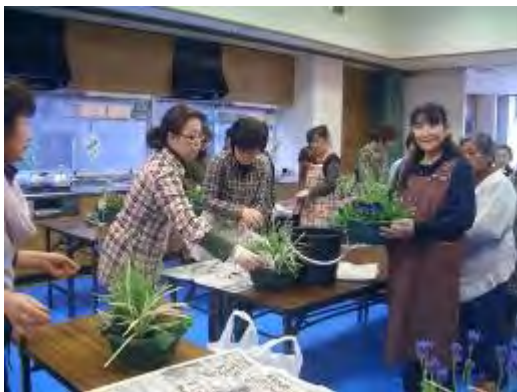
やっぱり自分の作品が1番かな?