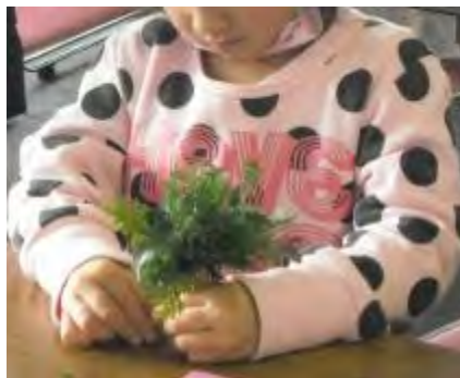
小さな子どもも上手に作っています