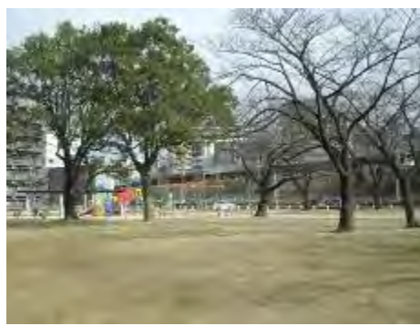
広場には大きな桜が何本もあります