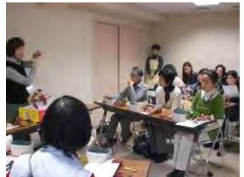
アレンジメントについて説明

難しい内容かと思っていましたが、スムーズに制作は進み、皆さんステキな作品が出来ました。