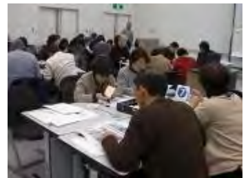
昨年の意見交換会の様子