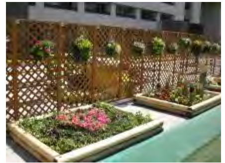
個性あふれる花壇が並びました