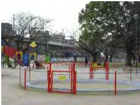
遊具も充実しています

お話を伺うと「公園がきれいになって、訪れる方が大幅に増えました」「何よりも公園を訪れた方に声をかけてもらうのが励みになっています」と笑顔で答えてくれました。ただし「犬の散歩の時はマナーを守ってほしい」という切実な悩みもありました。