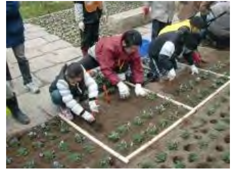
チューリップと一緒にビオラも植え付けました