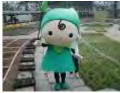
グリッピーも応援に来てくれました。