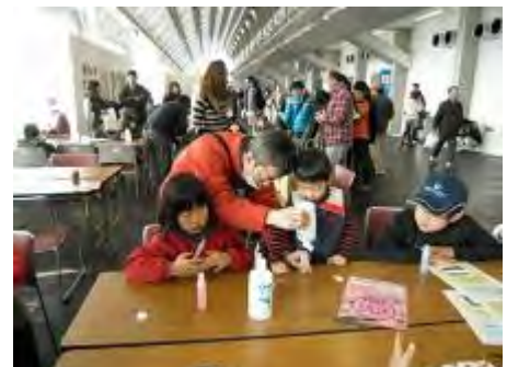
お父さんの方が真剣？