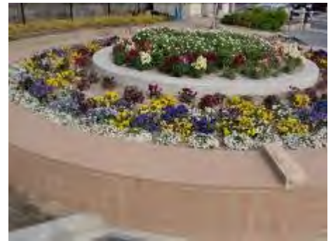
メインの円形花壇

公園のすぐ横には、新幹線・在来線と多くの線路があり、次々と電車が通っていきます。きっと電車の中から花壇を見るのを楽しみにされている方も多いのではないかと思います。