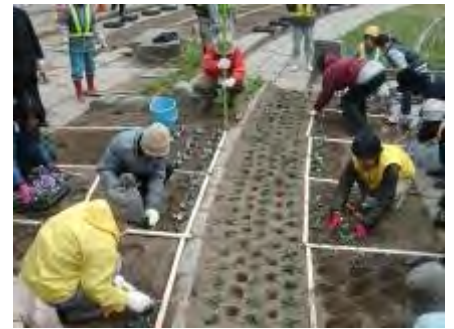
それぞれ役割分担をしてスムーズに植え付けていきます