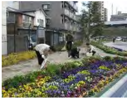
広い花壇を手入れされています