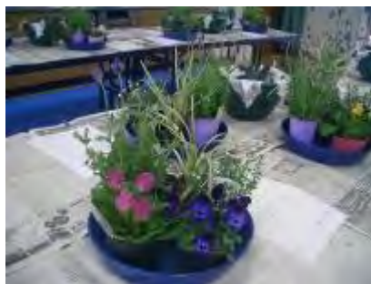
1人ずつセットされた花の組み合わせに、どれにしようか迷います

そんな様子をそっと眺めながら、「皆さん、とても満足していらっしゃいますよ」と、嬉しそうに言われた主事さんの笑顔がとても素敵でした。