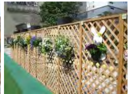
会場を彩った作品、壮観です