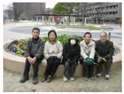
いつも活動をされている会員の皆さん