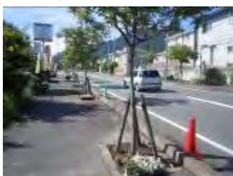
この通りに花を植えます

福岡市住宅都市局 公園緑地部緑化推進課 TEL: 711-4424 FAX: 733-5590 (公財)福岡市緑のまちづくり協会 みどり課 メールアドレス: aniju.t@midorimachi.jp TEL: 822-5832 FAX: 822-5848