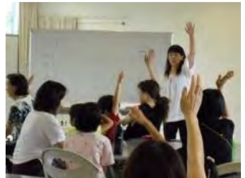
匂い当てクイズを行いました

教室もハーブの香りに包まれて、天然のアロマセラピーの環境の中、楽しく講座を行うことができました。