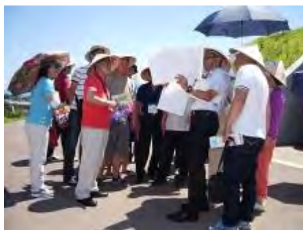
熱心な見学の様子

* 今回の訪問団の中の韓国花卉園芸福祉協会は、園芸福祉の講座を15週にわたって開講されます。園芸福祉ふくおかネットも福岡の活動事例やネットワークの事例など講座の中でお話しします。