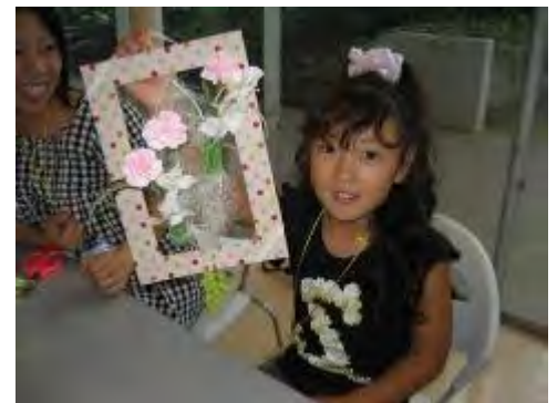
素敵な作品が完成