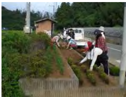
和気あいあいと作業は進みます