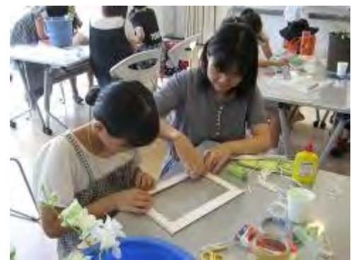
親子で仲良くフレーム作り

最後に皆さまの参加費の一部を東日本震災の義援金として寄付をさせていただきました。参加してくれた皆さまありがとうございました。