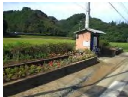
今は自動販売機の小家になっています

花苗の植え替えは6月、9月、12月の年3回行われます。9月11日（日）の植えかえには13名の参加がありました。水やり、草取り等は班を決めて当番制にしています。