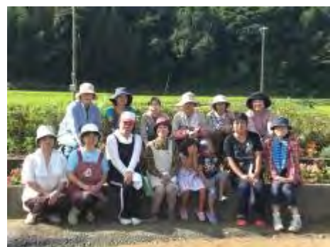
皆さんで記念撮影