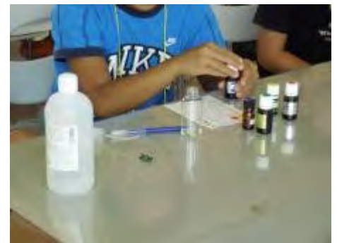
自分が選んだ匂いを慎重に容器に入れます