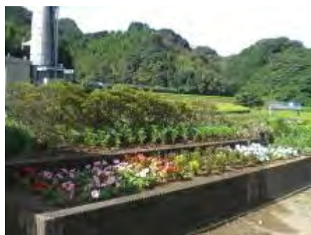
植え替えが終わってきれいになった花壇