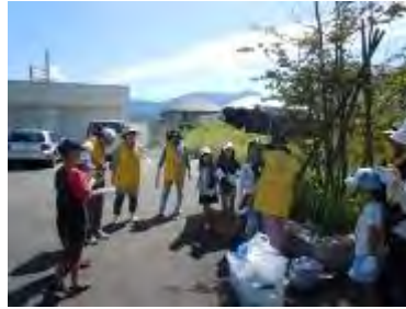
熱中症に注意しましょう

小さな子どもでも簡単に花植えの作業ができるように、前日に草刈り・土づくりをしました。9箇所の植え込み場所は、芝生の根がはびこり耕すのは一苦労でした。