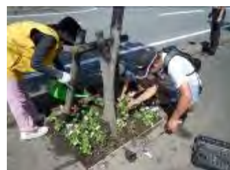
水やりもたっぷりどと...