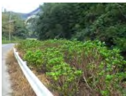
6月にはアジサイの花でいっぱいになります

今でも自然がいっぱいで、のどかな『草場』地区。取材に行った日も虫取り網を持った小学生の男の子が田んぼのあぜ道を歩いていました。日本の原風景を見るようでした。