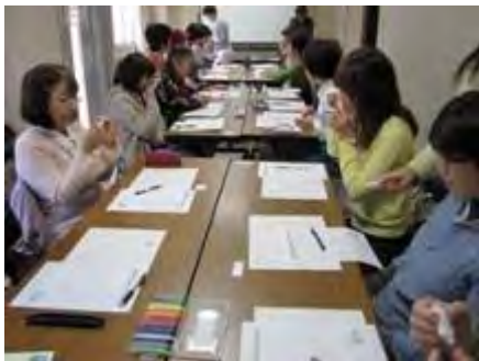
コットンに含ませた香りをかぎます

最後にそれぞれが作成した香りを試しあったり、自分でつけた香りの名前を発表したりすることで、受講生全員が盛り上がり、楽しく講座を終える事ができました。