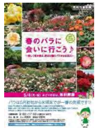
春のバラのイベント