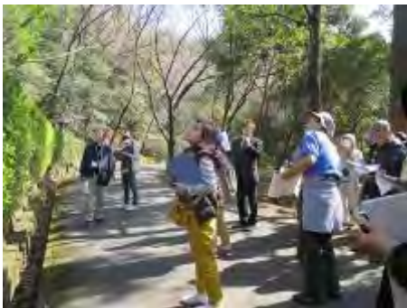
自然豊かな園内を見て回りました