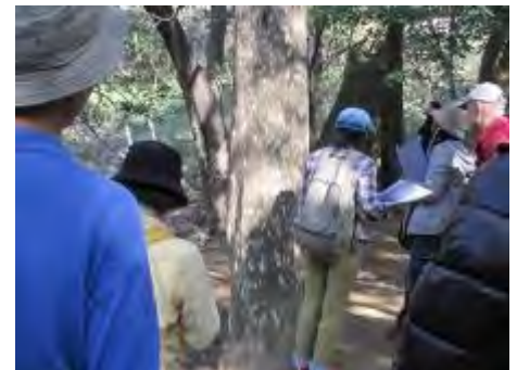
特徴のある樹皮をもつカゴノキ