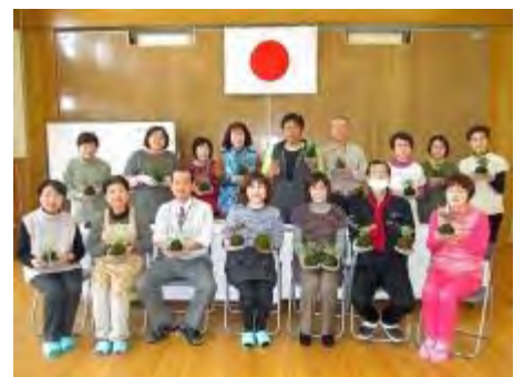
自分の作品を手に記念撮影