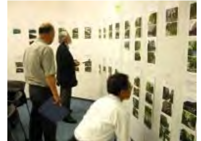
平成26年度一次選考実施状況