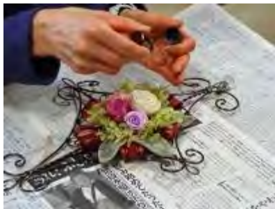
ソラフラワー（白色）にエッセンシャルオイルを染み込ませます