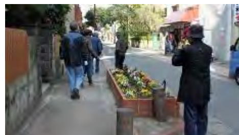
荒戸3丁目1区町内会