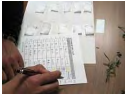
好き嫌い・どんな香り…などを記入します