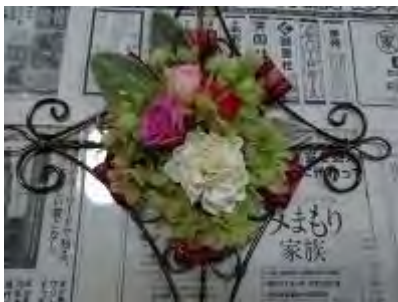
土台にリボン・プリザーブドフラワーを貼ります