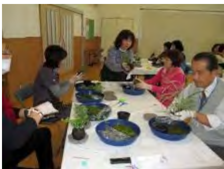
各テーブルを回って指導しました