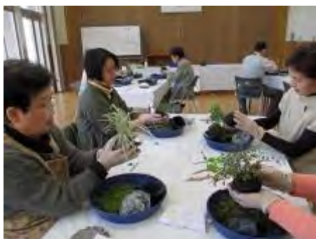
苔で上手に包んでいきます

和白東公民館での苔玉づくりは、糸巻の練習の時から和やかな雰囲気に入れ、時折笑い声が聞こえるほどでした。