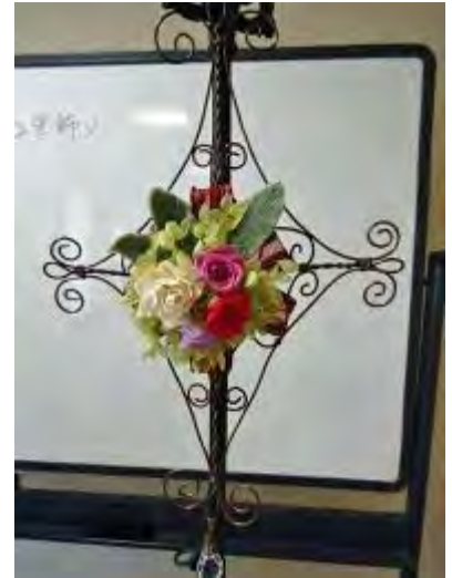
香りも楽しめる壁掛けが完成

最後に、ソラフラワーにエッセンシャルオイルを染み込ませ、香りも楽しめる素敵な壁掛けが完成しました。