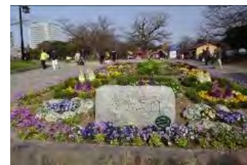
舞鶴公園フラワーボランティア