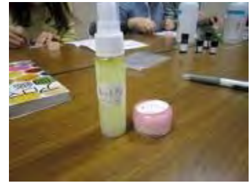
オリジナルの名前をつけて完成