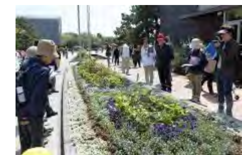
大濠公園ガーデニングクラブ