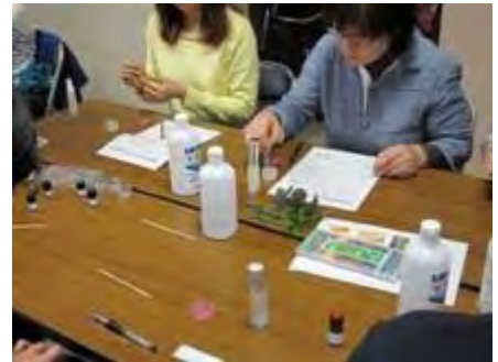
スプレーと練香を作成