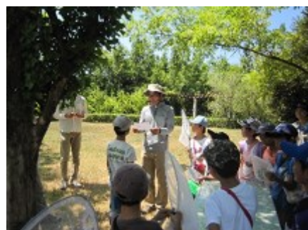
バッタ取り大会表彰