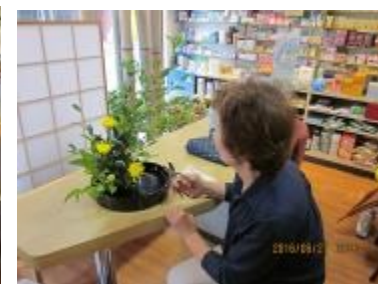
薬店の場所を借りてお稽古をしています