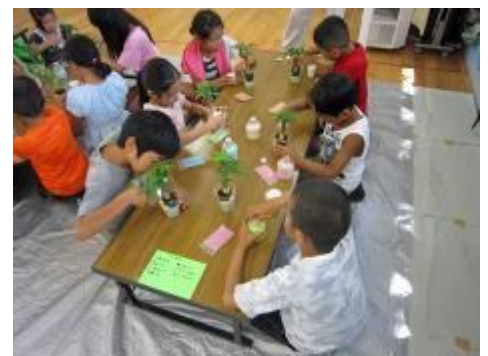
好きな色を入れていく