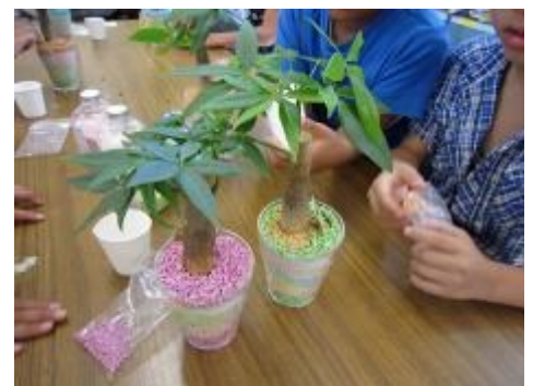
カラフルな作品が完成