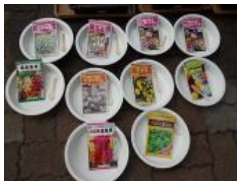
色々な種類の種を準備

子ども達とポットあげもして、花壇やプランターはもちろん、卒業式の花道を飾る花にしようとPTAの皆さんと話しています。