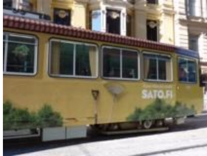
街角を走るトラム（路面電車）の外観 何かホッとさせる図柄&色彩