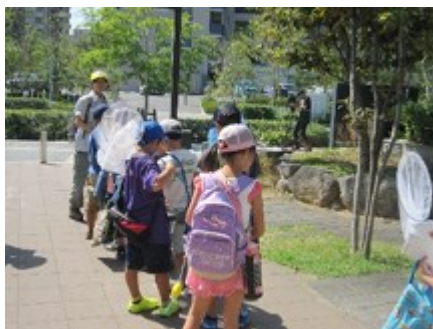
アイランドシティ中央公園へ移動