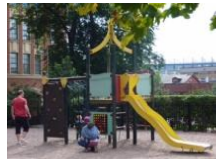
公園の緑に映える鮮やかな色の遊具