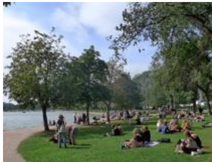
土用の午後の海辺の公園