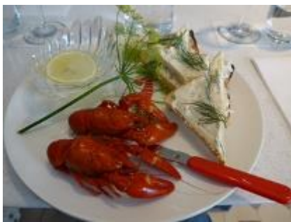
フィンランドの夏にはザリガニの日 があり良く食べられています