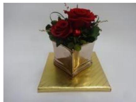
鮮やかなバラのプリザーブドフラワーを使った作品

早良市民センターから講座のお話を頂いてすぐに「緑のコーディネーターが講座を行うための研修会」があり、「これは私の為に開いて下さった！」と、勝手に勘違い。この研修会で学んだことで、気持ちも楽になり準備に取りかかることができました。