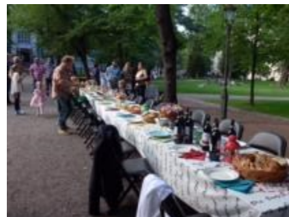
誰でも好きな場所でレストランが開ける レストランDAY（8月限定）