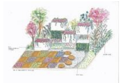
西日本短期大学大田ゼミ 『自然潤う街』