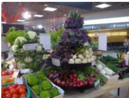
デパートの野菜売り場 ユニークなディスプレイ