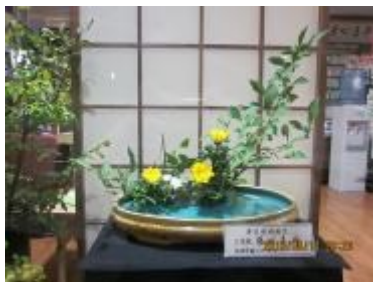
作品は毎週月曜日に入れ替えられます