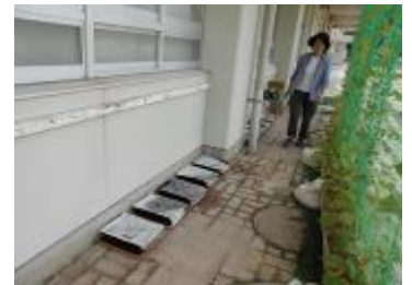
この場所に収まりました