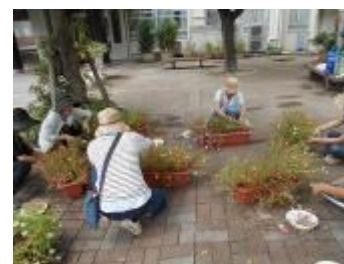
ポーチュラカの選定もしました