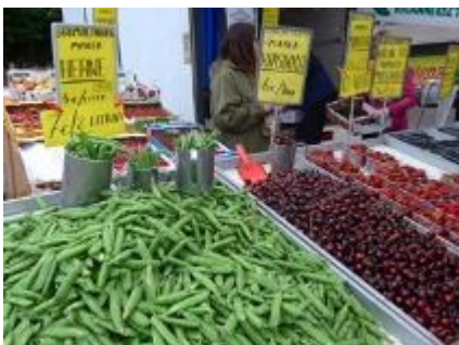
北欧ではグリンピースはフルーツ 歩きながら食べるのがオシャレ