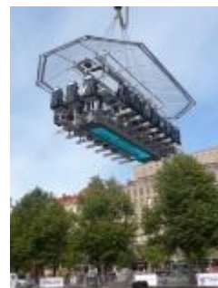
大人気のSKY・Dinner 地上100mで食事