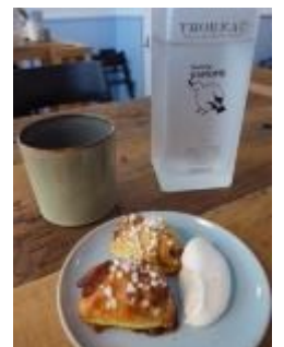
映画「かもめ食堂」で 有名になったレストラン