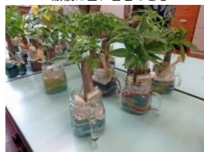
夏らしい作品が完成