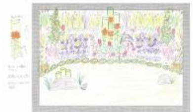
片江市民緑地グリーンメイトの会 『秋色の景色』