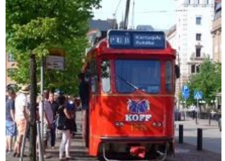
ビールやワインを飲みながら観光する パブ・トラム この夏限定です