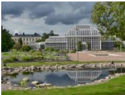
フィンランド植物公園