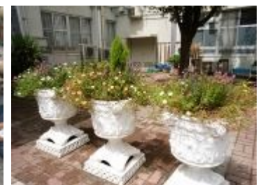
すっきりなったコンテナ