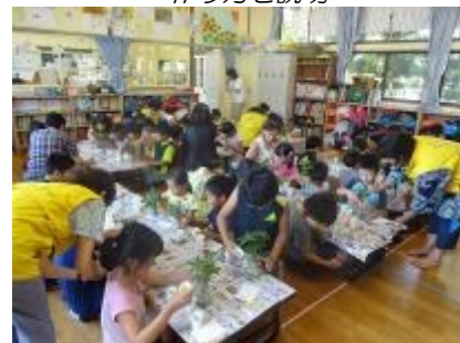
スタッフが見て回ります