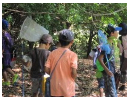
セミの抜け殻探し