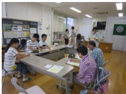
スタッフ・アシスタント向け説明