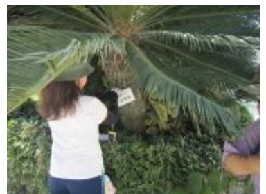
樹木の説明をしながら名札をつけていきました