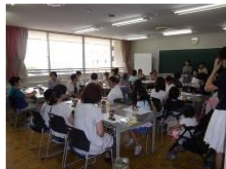
小さな子どもの参加もありました