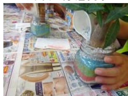
最後に白い石をのせる