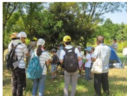
拠点テント確認、注意事項説明