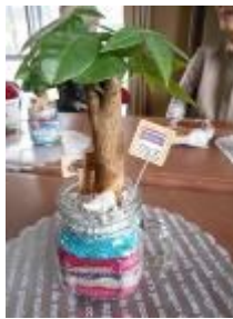
ブーケットの海を表現