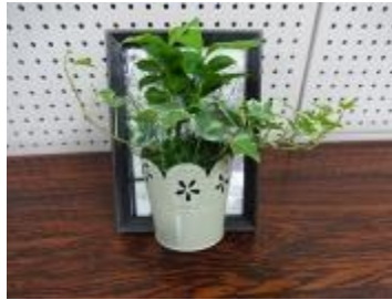
オブジェ風の作品が完成

新年早々の“観葉植物の寄せ植え”でしたが、この寒い時期での寄せ植えには、植物の根には無理があるかも・・・との思いもあり、あまり根を扱わなくても出来る簡単な寄せ植えとしました。