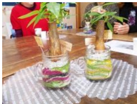
菜の花を表現(右側の作品)

南区の玉川校区、清水4丁目男女共同参画協議会のご依頼を受けて、パキラを使ったカラーサンドアレンジ体験講座を担当させていただきました。