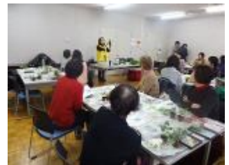
作業の手順について説明

そして今回は“色彩学&カラーコーディネートテクニック”について資料を配布し、参考&事例写真などを使って説明させて頂きましたが、講座終了後も参加者の方々から相談等もあり、私にとっても有意義な時間であったなあ～と思える体験講座でした。