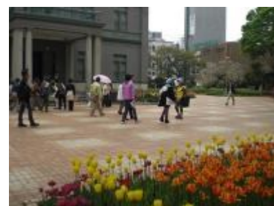
H26年4月に行った 街歩きの様子