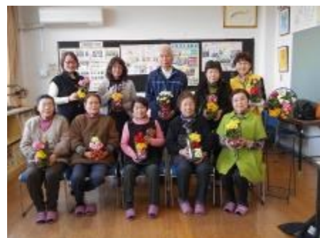
作品を手に集合写真