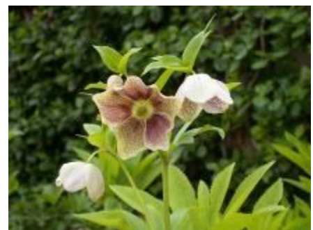
クリスマスローズ(針葉樹園)

さて、今年も3月14日(火)より、第19回福岡市植物園蘭展を開催します。ランの愛好団体による各種ランの展示や体験講座を行います。また、3月20日(月・祝)に福岡中央高等学校吹奏楽部によるガーデンコンサートを開催いたします。皆様のご来園を心よりお待ちしております。