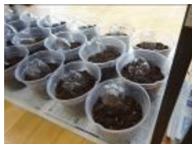
ペットボトルで作った土すくい