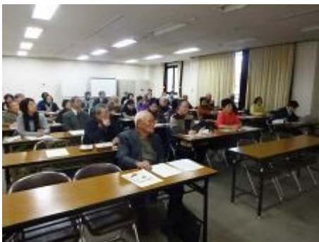
大勢の方が熱心に受講されました