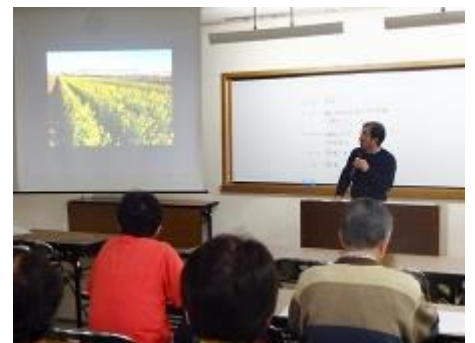
波左間さん：種まきの仕方を紹介