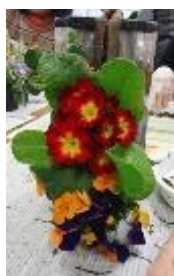
2番目の苗 プリムラ ジュリアン