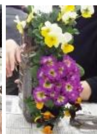
3番目の苗 ピオラを入れて 完成