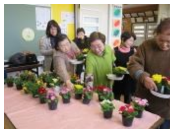
好きな花苗を3苗選びます

まだまだ寒く、曇り空が続きますが、パッと明るい花色で、気持ちも明るく過ごしていただこうで、良かったです。