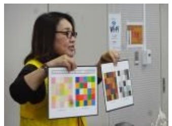
色見本を見ながら四季を感じてもらう