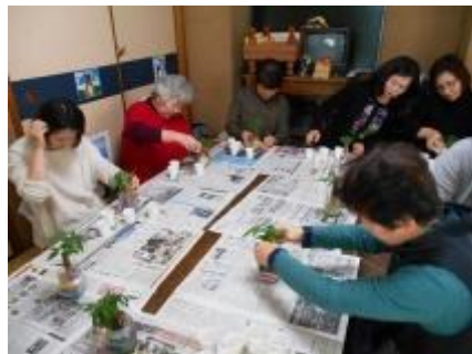
好きな色の砂を選んで慎重に入れていきます