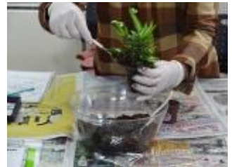
高さが違う2種類の観葉植物をポットに入れて土を補充する