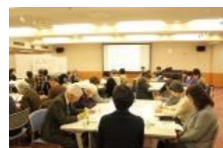
事業報告と事業計画説明