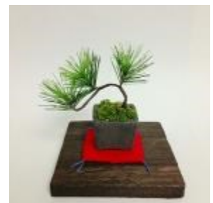
写真はイメージです