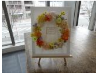
春らしいリースが完成