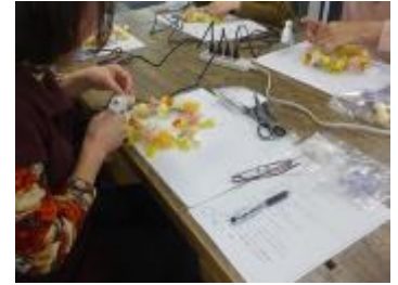
グルーガンで花材をつける

一足早く春を感じて頂きたくて、春らしいブライズドフラワーのアジサイやバラを入れたリース作りを行いました。