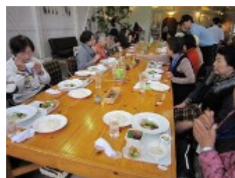
昼食の様子（グリーンヒル）