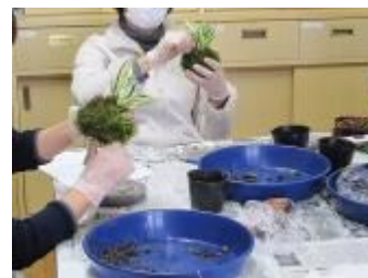
苔玉に糸を巻いていく