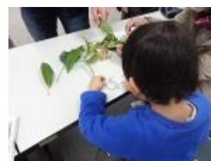
ルーペでオオバコの種を観察