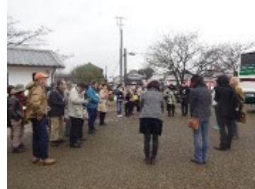
うきは市吉井町商店街見学