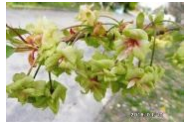
緑色の花の「御衣黄」