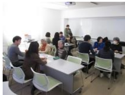
2/10：緑のコーディネーター6名