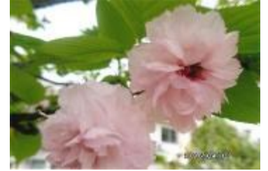
花弁が300枚になる「兼六園菊桜」