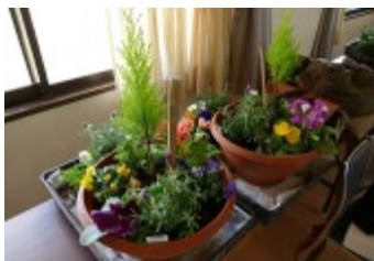
春らしいコンテナガーデン