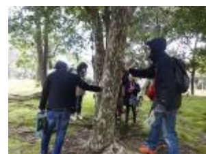
カゴノキの木肌に触ってみる