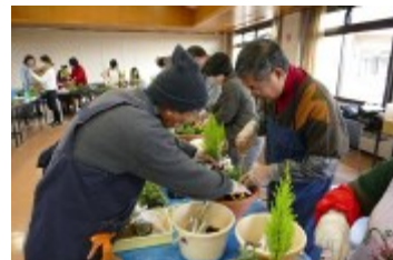
コンテナガーデンの作り方を指導