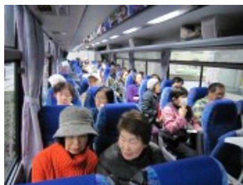
バス車内での様子

見学ツアーを終えて感じた事は、全てに愛があふれていて、それが心地よかった事です。地域や故郷への愛、植物への愛を一人でも多くの人に伝えようとしているのが分かりました。沢山の植物に癒されて、幸せな気分での帰路に着きました。