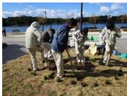
西日本短期大学の応援で芝剥ぎ

3月に入り、山江村から宇美町に彼岸花の球根の提供があり、残りの真ん中にある2つの円形花壇に、もらった球根を植えました。これからも少しずつ活動の幅を広げていきたいと思っています。