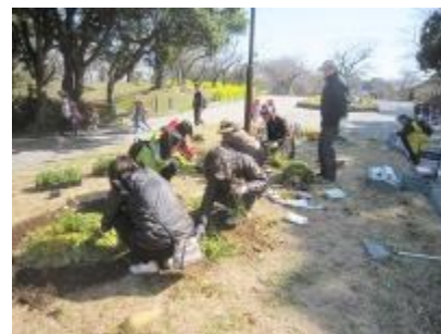
彼岸花の植え付け