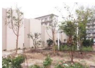
H28.10.19 移植されたナンジャモンジャ