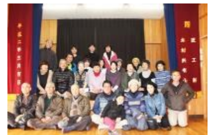
みんなで記念写真