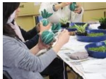
模型を使って糸巻きの練習