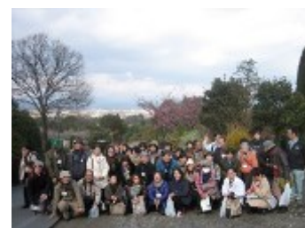
内山緑地（さんぼ道）