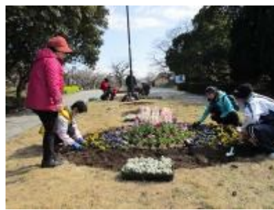
1号花壇の植え付け