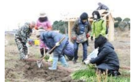
彼岸花の植え付け

夕方から開いた交流会の居酒屋に14名が集い、みなさん今日初めて会ったとは思えないくらい打ち解け、にぎわった宴でした。「今度は山江村に行こう!」と福岡組。「咲かそう!花の輪、人の環 グリーンツーリズム」は大成功に終わり、更に二次会のカラオケへ。みんな歌って歌って楽しい夜は更けていきました(笑)。