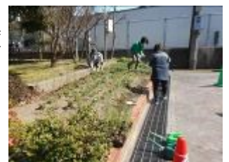
余った苗は花壇に移植