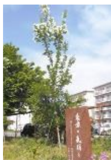
H23.5.7 九州がんセンターの ナンジャモンジャ

一部残った森脇記念庭園と新花壇もようやく植え込みが終わり、“癒しの庭”が生まれつつあります。2年もすれば、ナンジャモンジャの真っ白い花も見られるようになるだろうと期待しています。