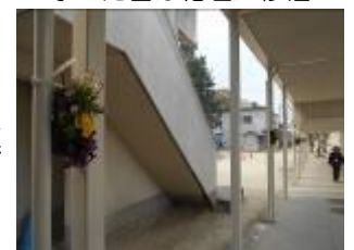
花道になる渡り廊下