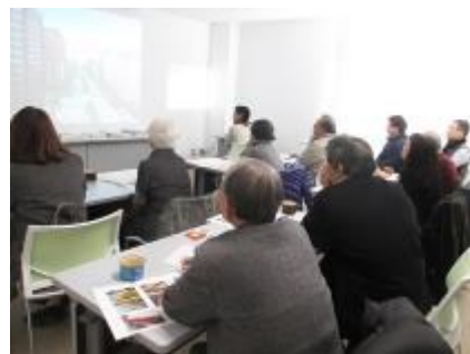
2/15：緑のコーディネーター8名