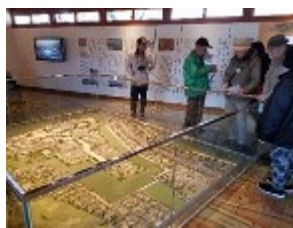
むかし探訪館での様子