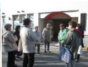
終了後反省会の様子