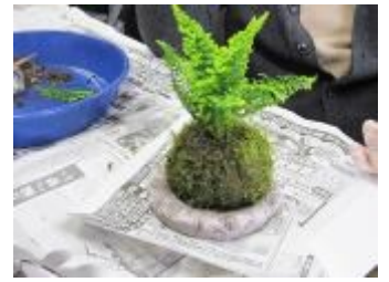
きれいな苔玉が完成