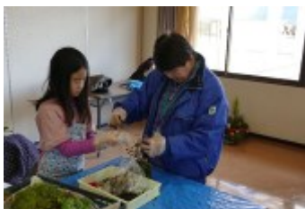
苔玉の作り方を指導