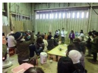
九州農園での説明