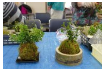
2種類の苔玉が完成