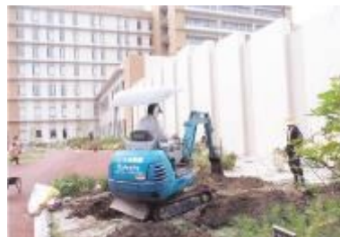
H28.10.19 ナンジャモンジャの移植作業