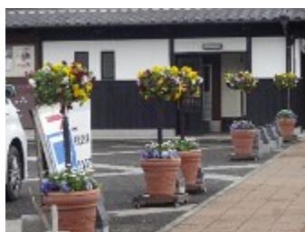
白壁通りのハンギング