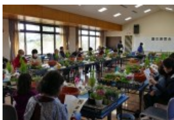
定刻前には全員が揃いました

コンテナガーデンは、ゴールドクレストを中央に配し、プリムラジュリアンやラベンダー、ピオラ、パンジー、ノースポール等を配色やバランスを考えながら植え込みます。苔玉には観葉植物の“プミラ”と“ワイヤープランツ”を使用しました。始めて苔玉づくりに参加した人の中には、苔の貼り方や糸の掛け方に戸惑う人も居ましたが、コツが解ると意外に簡単と、出来上がった作品を手に皆さん大満足の講習会でした。