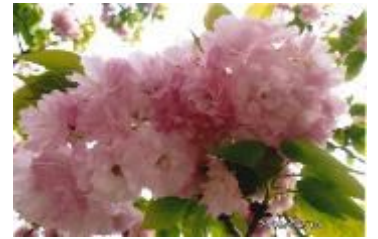
世界中で喜ばれる「関山」