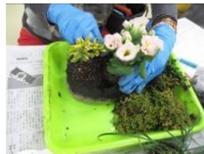
植物を植えていきます