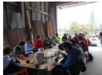
到着後おいしい食事をいただきました