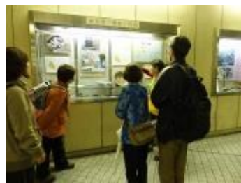
博多駅地下の埋蔵物展示