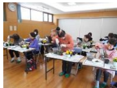
皆さん真剣に取り組んでいます