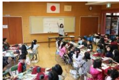
大勢の子ども達が集まり元気に講座が始まりました。