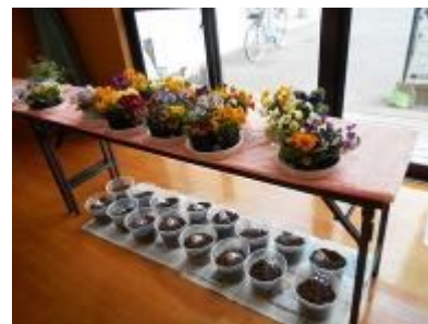
花苗・土の準備もOKです

西新公民館の玄関先に置いてある、ペットボトルで作った花飾りを作りたいとの声が寄せられて、「西新公民館だより」で希望者を募り、3月14日に講座開催となりました。