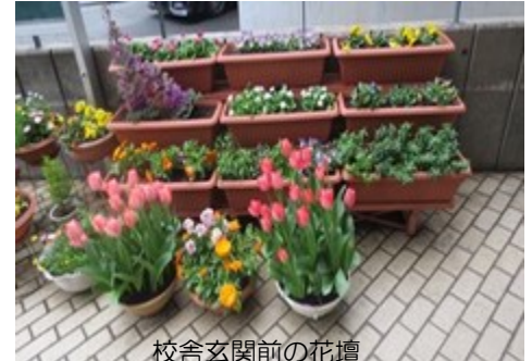
校舎玄関前の花壇