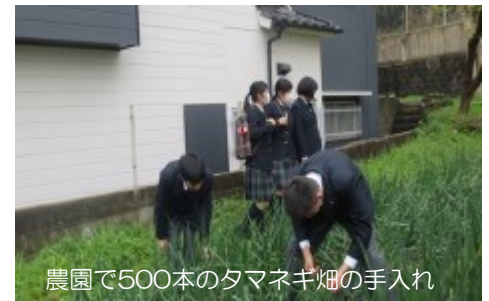
農園で500本のタマネギ畑の手入れ