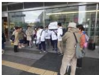
博多駅大時計の下に集合 2班に分かれて出発

博多駅集合で、花を愛でながら博多の歴史も感じつつ、天神・警固公園まで歩きました。時間内に納まらなくて申し訳ありませんでしたが、皆さん健脚で到着してからも笑顔だったのでホッとしました。