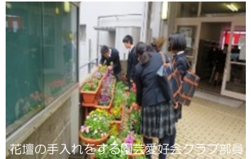
花壇の手入れをする園芸愛好会クラブ部員

鍬やスコップで畝作りしたことや、種を蒔き成長した大根を引き抜いたこと等、高校卒業後、時にふれ思い出してもらえたら嬉しいなあと思いつつ、春爛漫の陽を浴びながら、ボランティア活動に勤んでいます。