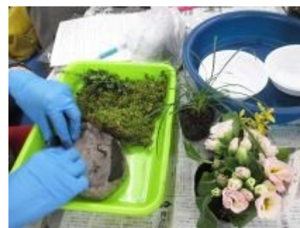
ケト土で土手を作ります

エコ皿の縁の土手作りが厚すぎてケト土が足りなくなり追加する事もありましたが、1時間位で全員とても上手に仕上がりました。後回しにしていた各材料の説明の良く聞いて頂けました。そして花が終わり苔が枯れた状態になっても捨てないで、球根や種を埋め込めば違った作品になる事を伝えました。