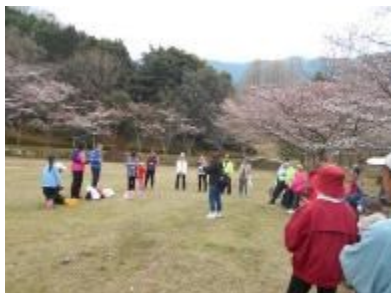
桜の公園で抽選会