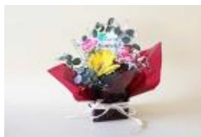
素敵な作品が完成