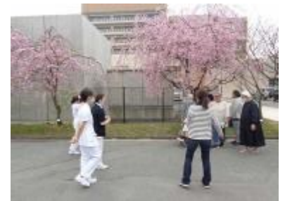
病院の職員、患者さんも訪れました

この『憩い通り』には、ほかに駿河台匂い、関山、普賢象、兼六園菊桜、楊貴妃、天の川などがあり、中旬ごろには満開になりました。