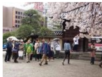
桜が満開の東長寺