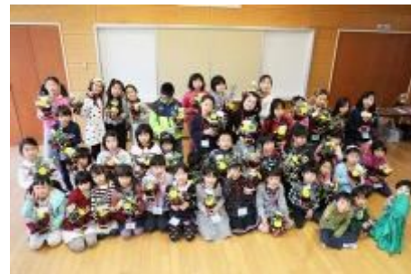
作品を手に記念撮影

長さや切り方に、個性が沢山でた素敵なアレンジメントが出来ました。それぞれの想いを書いたメッセージを添えて、笑顔で持ち帰りました。皆さんから4,417円を「国際こども花基金」に募金して頂きました。今回のような公民館のつながりが広がっていくと嬉しいです