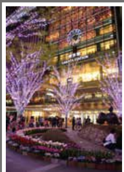
第15回イベント部門特選 「春爛漫の博多駅」 橋本禎寛