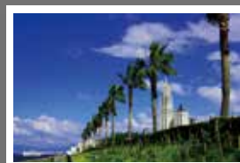
第15回 9月カレンダー賞 「真夏の昼下がり」 角芳郎