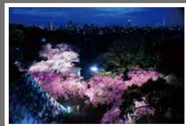
第15回さくら部門特選 「舞鶴城夜景」 山本和弘