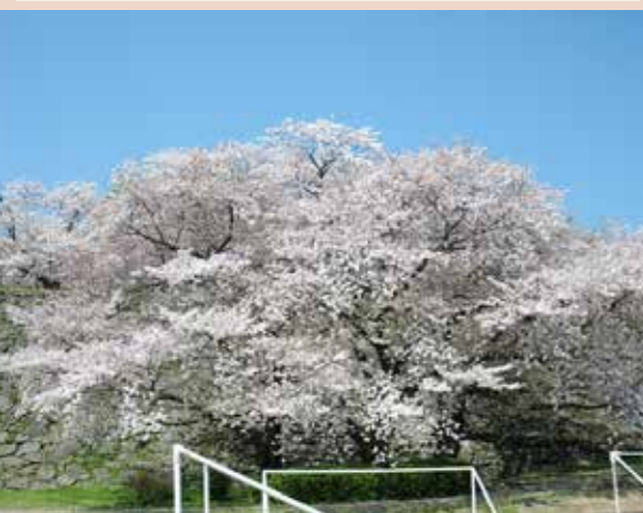
spot7 球技場横のソメイヨシノ