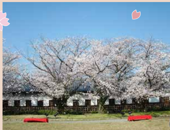
spot5 多間橋のソメイヨシノ