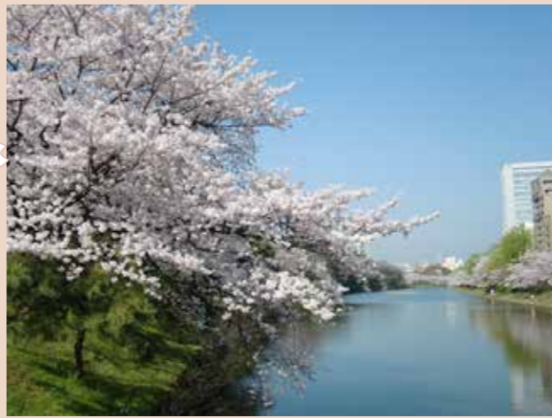
spot1 上の橋からみる濠と桜