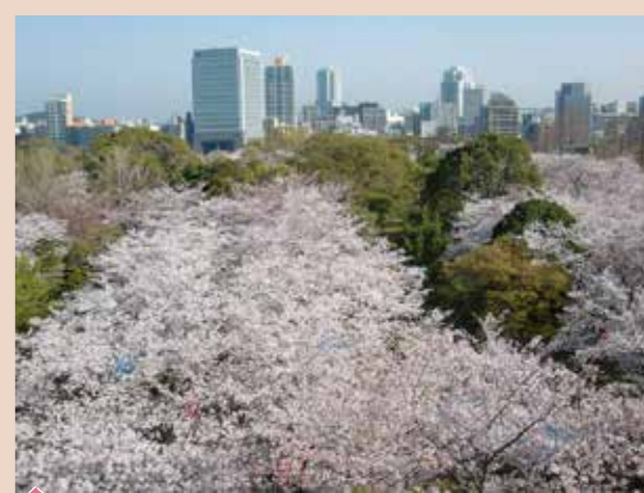
spot3 天守台からのながめ