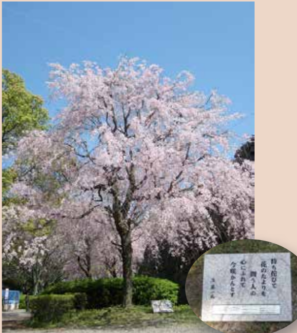
spot6 二の丸のシダレザクラ 故進藤元福岡市長の歌碑があります。

お濠端(バス通り沿い) サトザクラ系のカンザンが多く植えられています。ソメイヨシノが咲いた後に咲きます。(4月上旬~中旬頃) カンザン(関山)