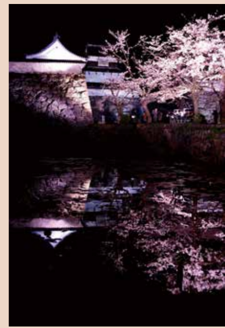
spot2 桜のライトアップ 第14回花と緑のまちかど写真コンテスト入賞作品 「夜空にかがやく桜と城(西畑修)」