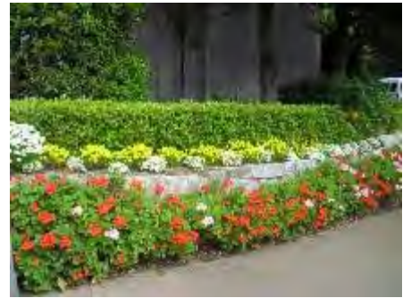
ウエストヒルズ花ボランティア