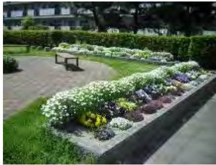
四箇田分譲団地ガーデニング・クラブ