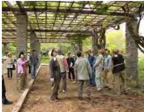
フジ棚の下でフジの特長についてお話があり、真剣に聞いています。