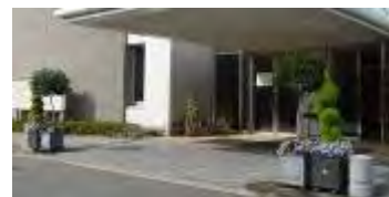
玄関前のコンテナ