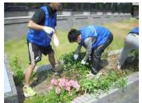
木の根は男子が掘り起こして くれました