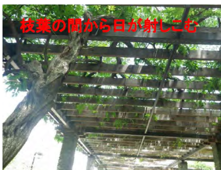
5月～6月は、花柄摘みと小枝透かしをします。