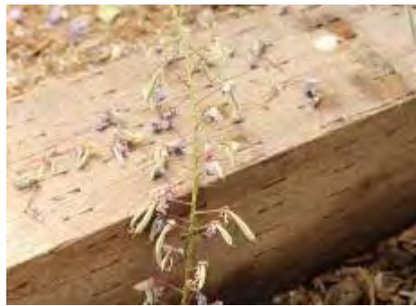
豆になったフジの花は早目に剪定します。