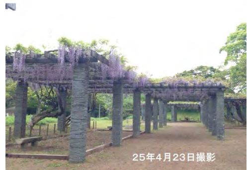
今年の舞鶴公園のフジはきれいに咲きました。