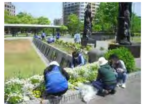
各エリアに分かれ、花柄つみ・除草 を行いました

今回の参加者は、皆、熊本の方で配属先も熊本の方ばかり。私の後輩や、お父さんが高校・大学の後輩の方がおられ、より親しく作業が出来て、良い思い出になりました。