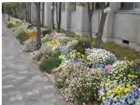
まっすぐに伸びた花壇は希望を感じます