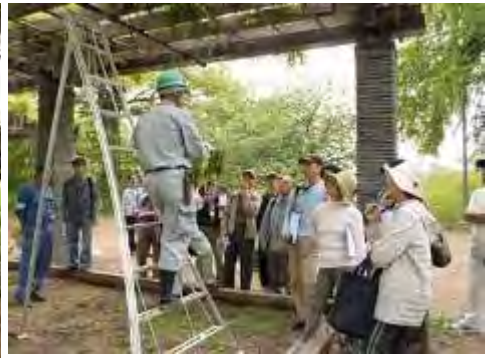
重なった枝は、上の元気な部分を残し下の枝は剪定します。