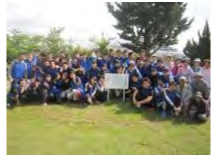
がんセンター「花の仲間たち」 作業終了後の記念写真