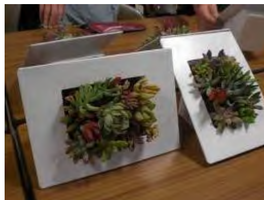
立体的な素敵な作品が完成