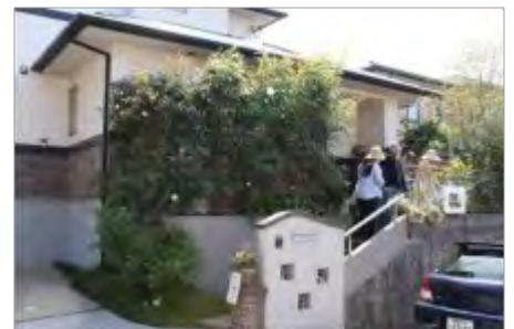
「お邪魔します」と声をかけて中へ