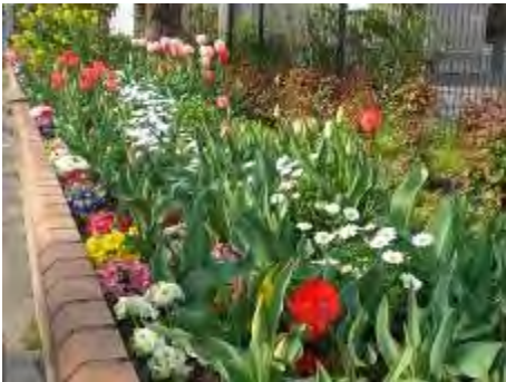
フラワーアップ高宮