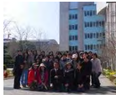
今年の卒業式前の作業を終えて