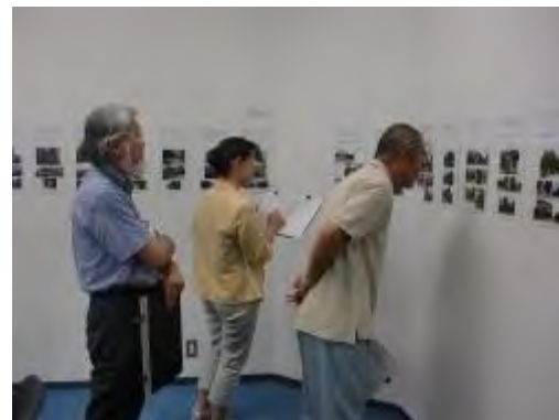
平成24年度一次選考実施状況