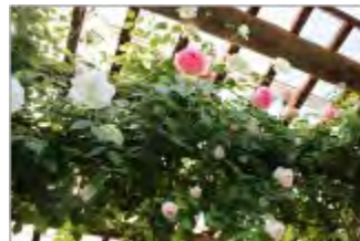
バラが満開でした