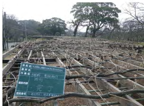
12月～2月はひとつの枝に花芽を3～4個残り強く剪定します。