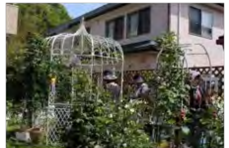
裏に回るとみごとな庭が待ち構えています