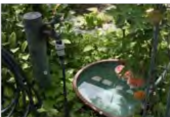
水栓にもこだわりが・・・