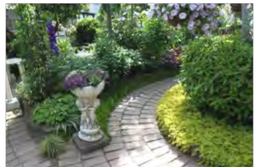
木のまわりに植物を立体的に配置