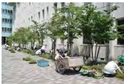
活動日には大勢の参加者があります