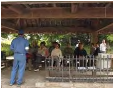
牡丹・芍薬園のあずまやでフジの基礎知識を学びました。

帰りに護国神社側の池に黄色・ピンクのスイレンが綺麗に咲いていました。今回の研修、楽しかったです。ありがとうございました。