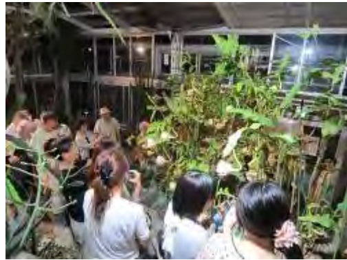
昨年の月下美人観賞会の様子