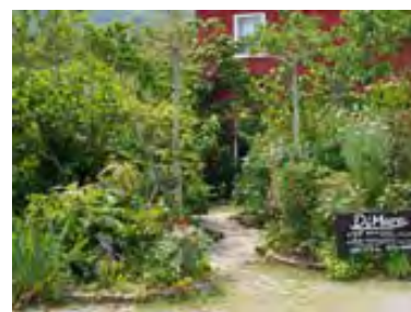
第10回花と緑のまちづくり賞 イタリアンレストラン ティ・マーレ