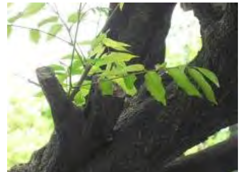
ヒコバエ、ヤゴ、徒長枝は花芽がつかないので切除します。根元から切ると病気の原因になります。