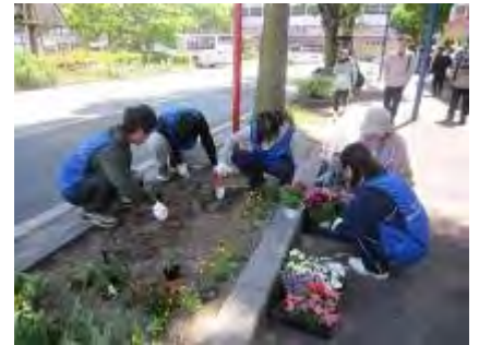
西鉄大橋ロータリー 花苗植えつけ

以上7日間8団体に分かれて新入行員のボランティア活動を行ないました。行員の方々が大変感激していたとの事です。この間天候に恵まれ、事故もなく無事に終わりました。各団体の方々、「あすみん」職員、みどり推進課の方々のご協力に感謝します。