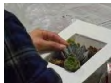
絵画を描くように多肉植物 を配置します