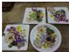
好きな色の台紙に押し花を置いていきます