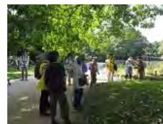
ムクロジを観察 ここで解散