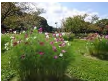
8/23緑のコーディネーター・活動団体の皆さまに植え付けて頂いたコスモスが満開です

今年は花装飾でグリップキャンペーンを事前告知をしていただきました。開催前から美しい花飾りで公園を訪れる方にお知らせすることができました。