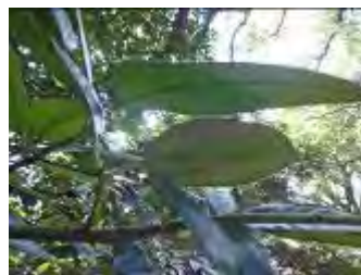
文字が書けるタラヨウ