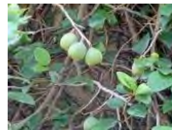
樹木に絡みつくオオイタビ

午前10時に舞鶴公園管理事務所前に集合。応募者17名の内参加者は14名で、天候にも恵まれ散策するには最適の日和でした。