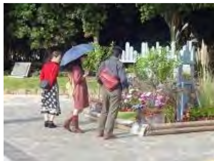
10/7「みどりちかまる」にデザイン制作して頂いたウエルカムガーデン