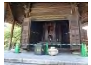
開放された六角堂