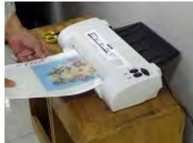
ラミネーターに通します