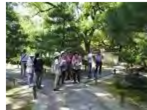
常緑樹が多い承天寺