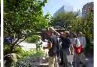
2班に分かれて櫛田神社から説明