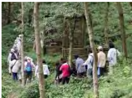
カブトムシの森を見学

最後になりましたが、みどり課の方、森を育てる会の方、お世話になりました。有難うございました。