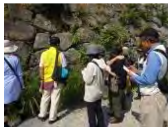
石垣に生える植物を観察