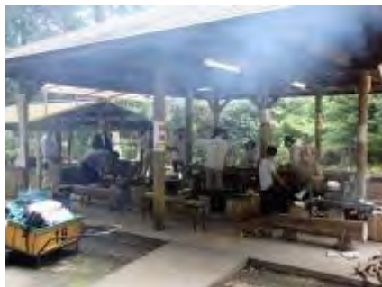
楽しいバーベキュー