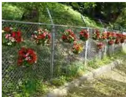
10/5緑のコーディネーター養成講座受講生に制作して頂いたハンギングバスケット