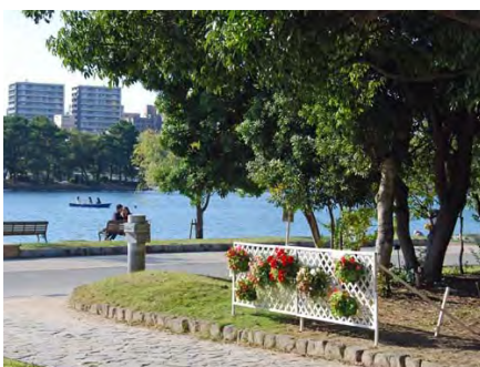
9/27「園芸福祉ふくおかネット」に制作して頂いたハンギングバスケット