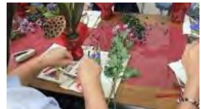
ペットボトルの器に蓮の実・ドラセナ・リンドウ・菊・吾亦紅を入れていきます。

今回は使いませんでした。ヒメジオン、野菊などなど可愛い花や穂など、秋を、いえ四季を感じさせてくれる野草が沢山の舞鶴公園です。できれば草刈りの時期に合わせて管理事務所より野草の提供を受け、アレンジメント講座ができればいいな…と、思っていました。