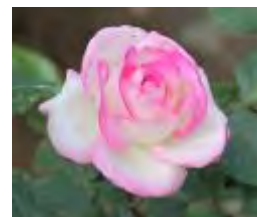
バラ（プリンスドゥエック）

☆植物園ホームページ http://botanical-garden.city.fukuoka.lg.jp/