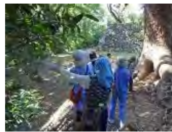
大きなクスノキに感嘆の声