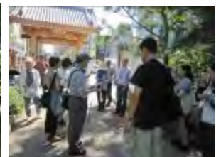
博多千年門で解散