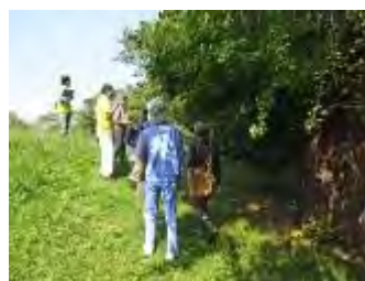
藤棚の横のイヌビワを観察

ゴールのお鷹屋敷跡では、樹木に絡みつくオオイタビや、ムクロジの実を観察し、時間内に終了しました。参加者の皆さまはとても熱心で、説明した樹木や植物に興味津々で会話も弾んでいました。