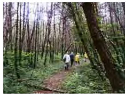
生の松原の保存活動のみなさんと「わたしの木」の参加者