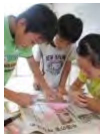
まず、ケーキの 土台作り