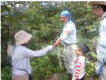
「森を育てる会」の会員より鎌の使い方を教えてもらう親子

市民の森として親しまれている油山の保全活動を行っている、「森を育てる会」のボランティア活動を体験して、他の団体の行う体験し、また生の松原の保全グループ『美の松露』と共同で参加することで、共通の思いや、知識（油山はアカマツ・まつたけ、生の松原はクロマツ・しょうろ等）を紹介できる場として参加しました。