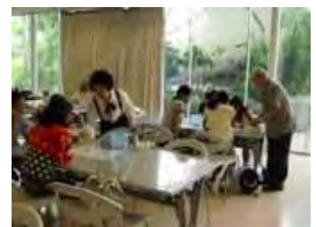
環境カルタを使ってのビンゴゲーム