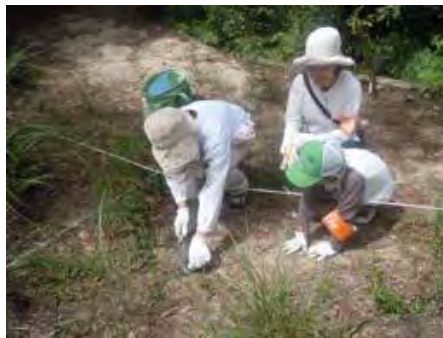
実生の松の周りの草刈をする有吉会長と、真剣に観察する親子