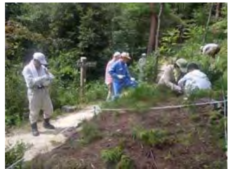
「わたしの木」「美の松露」の参加者