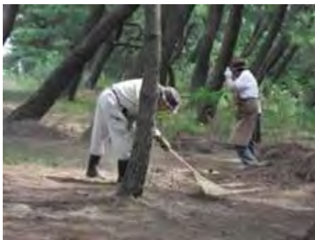
松葉集めも手慣れてきた

8月の定例作業にも「わたしの木」から7名が参加しました。この日は、生の松原松葉清掃作業グループの名称が「美の松露」と発表されました。松葉は会員が飼っているヤギが大好きだそうです。