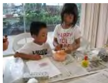
姉弟で参加「どこに飾る？」