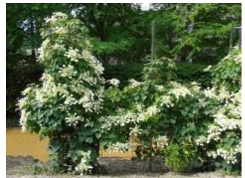
イワガラミ「ムーンライト」

また、温室では、世界一大きな葉をつける植物としてギネスブ ックに載っているオオオニバスが見頃です。今年は特に生育が良く、 現在、大きいもので直径120cmまで成長しています。8月頃には オオオニバスの試乗体験を行う予定です。詳細につきましては後 日、ホームページに掲載いたします。