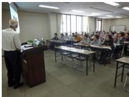
大勢の方が熱心に受講されました