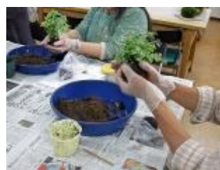
土を落とし丸く整えます