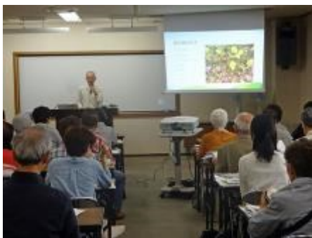
スライドを使った説明