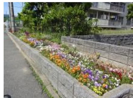
「姪浜北住宅環境美化クラブ」の花壇