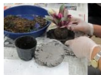
平らにしたケト土で包みます