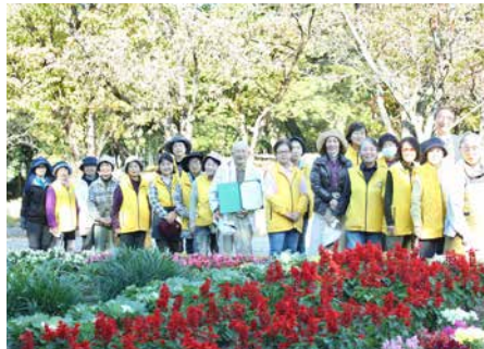
舞鶴公園 フラワーボランティア