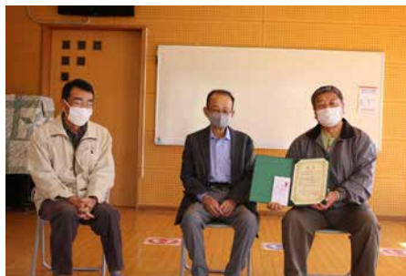
美和台校区 花いっぱいにする会