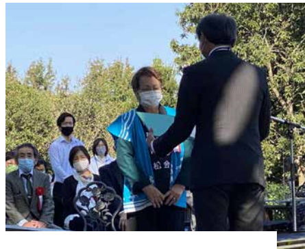
特定非営利活動法人 はかた夢松原の会