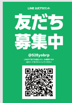
緑のコーディネーター