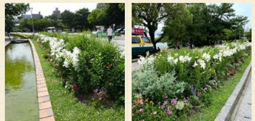
花壇を見る距離や方向によって美しく見えるように工夫された花壇

マラソンコース側と歩道側の両方から（写真参照）、人々が花壇を見ることが出来るのです。なお、5か所の花壇のうち3か所は歩道側に水路があるので少し離れたところから花壇を見ることになり、その水路幅分の距離があっても、美しく見える工夫が必要です。