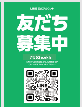
花・森づくり活動団体