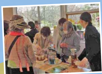
ハーブティーと 焼き菓子でおもてなし