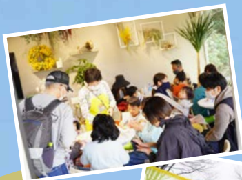
ワークショップやマルシェ、 様々なプログラム。