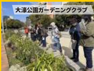
大濠公園ガーデニングクラブ

19年続くボランティア花壇。多年生 植物メインのローメンテナンスでデザ イン性の高い花壇作りのノウハウや団 体運営について惜しみなく教えていた だきました。これからの植物園につ いても意見交換しました。