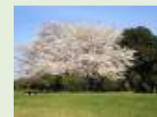
西南の杜湖畔公園