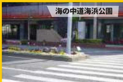
海の中道海浜公園

超★BIG サイズの堆肥ヤード!! 熟成 途中の堆肥はあつたかくて湯気が出 ていました。切り返しもふるいも重 機を使うんですって! バラ園で、冬 のバラの管理も教えていただきました。