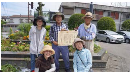
片江市民緑地グリーンメイトの会