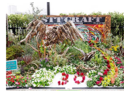
(株)地球のこども舎