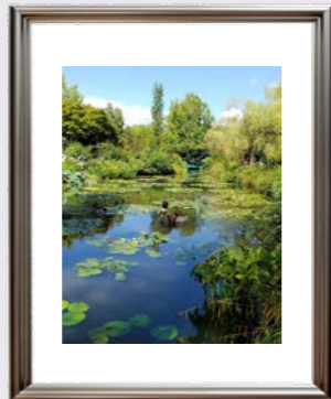
モネの庭 (高知県北川村)