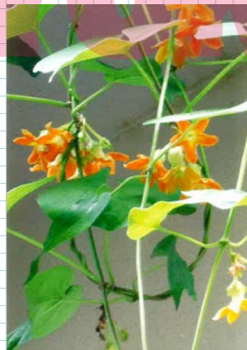
▲ イエライシャン (夜来花) 昼は閉じていますが、夜になると花が開き甘い香りがします。 温室展示説明より (Green house)

大分県の筑後川のふるさと、小さな山あいの村の森の水が筑後川となり、中流域を潤し、福岡都市圏の水道水を配水し、有明海の家を育て、その先200海里までも漁場を豊かにするという取り組みは2000年3月より始まる。広葉樹の森を育てる地道な活動を「200海里の森づくり」という壮大なスローガンと「よみがえれ! 海のめぐみと大地のめぐみ」の合言葉に置き換える取り組みがこの先も長く続いて貰いたい。途中鯛生金山に立ち寄り福岡市に着いたのは17時半でした。