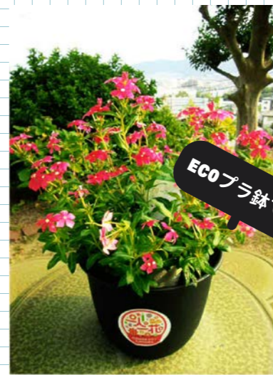
フェアリースター ▲ 植木鉢を華やかに彩る Fairy Star (愛らしい極小輪のニチニチソウ) /福岡市南区・実家~

退園の際、緑の相談所前に山積みされていた「一人一花」シール貼付の植木鉢に目にとまり、おひとり様一鉢お持ち帰り自由とのこと。ありがたく頂戴♪ グランマに植木鉢のお土産、よかろうもん!