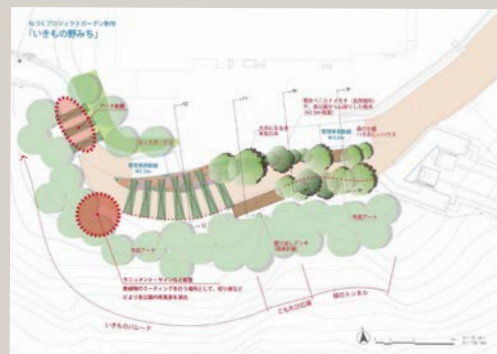
みんなで意見を出し合いながらまとめたデザインの平面図。

みんなで話し合って作り上げたイメージを、1つにまとめました。つい数日前、動植物園の職員さん、まちづくり協会の皆さんにプレゼンし、好評価でした！！これから制作に入っていきます！！デモンストレーションは、一人一花サミット1日目の11/11(土)です☆