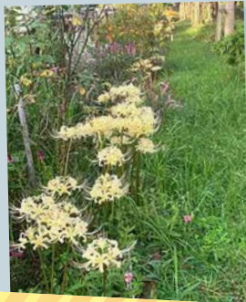
おおまち自然と緑を楽しむ会