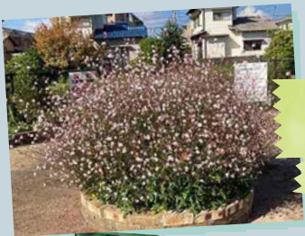
泉東町内会 ひょうたん池 花壇愛護同好会