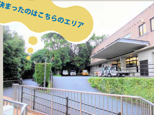
動物園と植物園をつなぐ通路・スロープカー乗り場のところ。