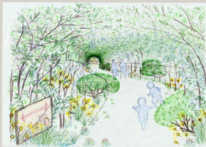
思わず飛び込みたくなるような緑のトンネル。イメージ図も自分で描きました♪上出来☆

こんにちは！久々の【ねづく】レポートです♪ 3年計画のねづくプロジェクトは、2年目に突入し、《演習》のカリキュラムに入っています。この秋の一人一花サミットでは、新しいガーデン作りのデモンストレーションを行いますので、ぜひ観にいらしてくださいね！！