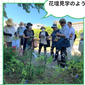
花壇見学のようす