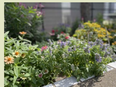
手入れの行き届いた素敵な花壇