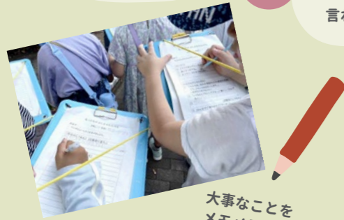
大事なことをメモメモ～