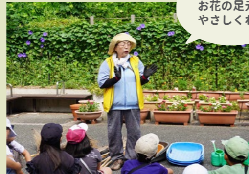
水やりはお花の足元にやさしくね。